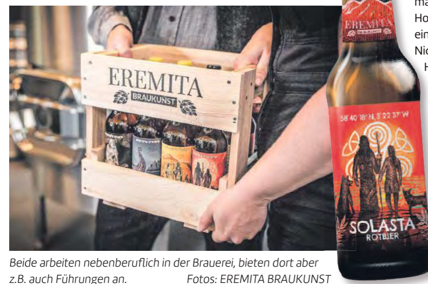
Beide arbeiten nebenberuflich in der Brauerei, bieten dort aber z.B. auch Führungen an.