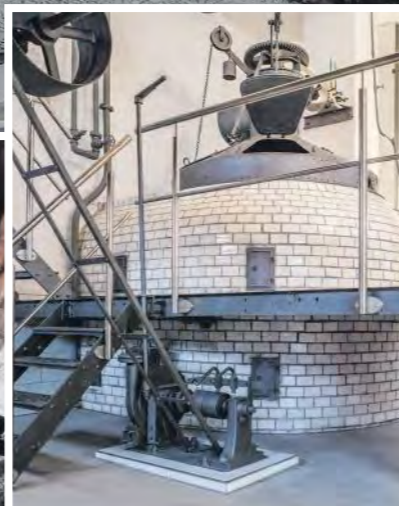
Im alten Sudhaus kann man heute Schlemmen.

moderne Brauerei beherbergt, bieten Einblicke in die Brautraditionen der Vergangenheit.